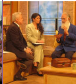
19 de Abril, Miami, FL Entrevista en vivo en el programa de TV "Quíereme Descalzi"