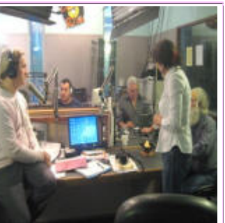
23 de Abril, Miami, FL Compartiendo el Agnihotra en vivo con el publico de "Radio Zero". Los locutores también se animaron a consumir la Ceniza Sanadora