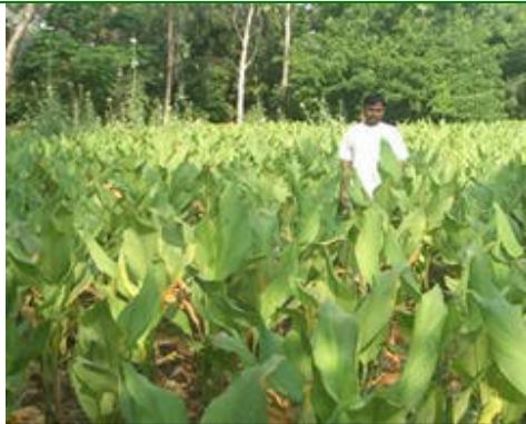
La planta de cúrcuma llegó a una altura de 5 pies (1.5 metros)