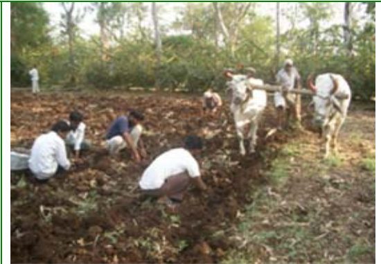
Cosecha de cúrcuma