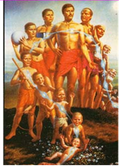
La práctica de Agnihotra nos ayuda a romper el CICLO DE VIDA y MUERTE y nos lleva de regreso a la Fuente.

(Yagnya, Daana, Tapa, Karma y Swadhyaya). Esta es la religión eterna que fue dado a través de los Vedas.