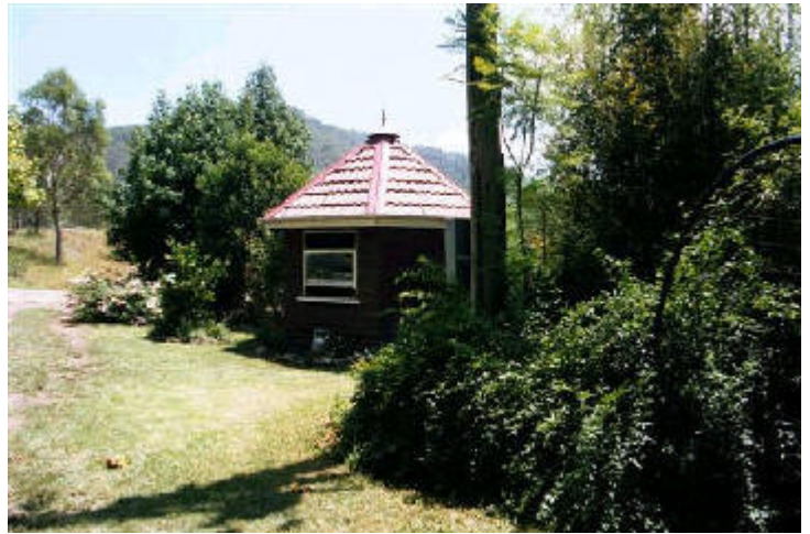
La Choza de Agnihotra de Om Shree Dham, donde se practica diariamente los Fuegos Sanadores.

Aguas sub-ARTESIANAS fueron encontradas a treinta y tres metros (100 pies). El laboratorio evaluó y encontró que era muy salina y alcalina. Aquí había una oportunidad de ver lo que la Terapia HOMA podía hacer. Hicimos AGNIHOTRA cerca del pozo y le pusimos ceniza de AGNIHOTRA con regularidad. El Ministerio de Recursos Hídricos estaba haciendo pruebas continuas en los pozos en nuestro vecindario y todos estuvimos asombrados al ver como la salinidad y la alcalinidad bajaba con cada informe del laboratorio hasta que se convirtió en agua potable.