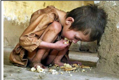
Un niño muriendo de hambre como ocurre en muchas partes del mundo.

Las inundaciones, las sequías, los cambios climáticos drásticos, el calentamiento global, el daño en la capa de ozono; Los desastres ecológicos, la contaminación, la lluvia ácida, la radiactividad, la extinción de especies; Los Transgénicos; Tecnología para controlar la mente de los pueblos; El caos, la guerra, la violencia en contra de la mujer, los niños, inocente, etc.; El dolor y la hambruna; Corrupción en todos los niveles; Más enfermedades físicas y mentales; Descomposición de la unidad familiar y la sociedad; La violación de los derechos (humanos, animal, la naturaleza ?); El incremento de consumo de drogas (legales e ilegales); Etc.