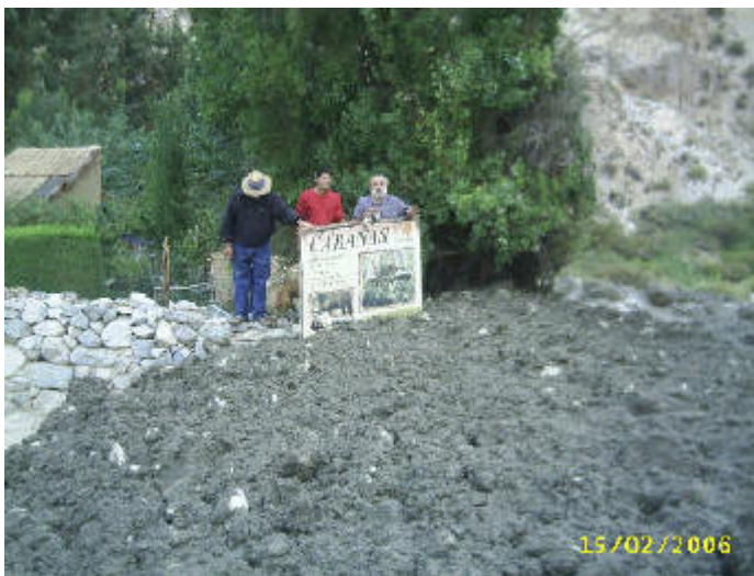
The avalanche stopped right in front of Albaricoque and then turned. It did not touch even a hair of this property where the Homa Fires are being practiced since 20 years.

Y por el lado en que el lodo debería haberse vaciado hacia el estacionamiento primero y después las cabañas, se levantaba una pared de 3 metros hacia nosotros, sin avanzar ni siquiera para topar un auto que había