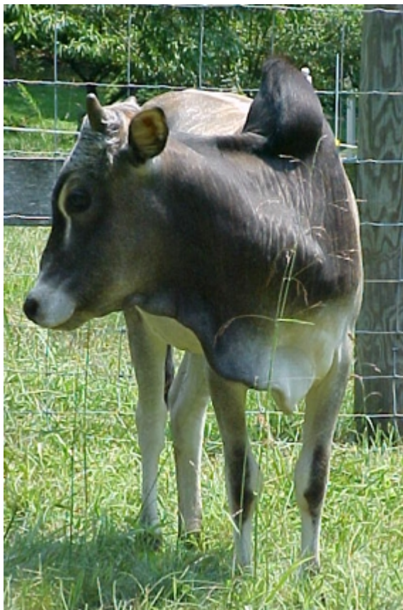
Ganado Homa y su leche no han sido afectados por la Radioactivitat de Chernobyl.

www.terapiahoma.com - www.homa1.com - www.homatherapy.info