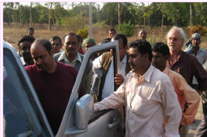
En Mohan Bhata, Bilaspur se conectó la computadora a los parlantes del carro para presentar la TH.