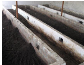
Las lombrices de tierra en la atmósfera Homa se reproducen rápidamente y producen "Oro negro" (Humus) de buena calidad.