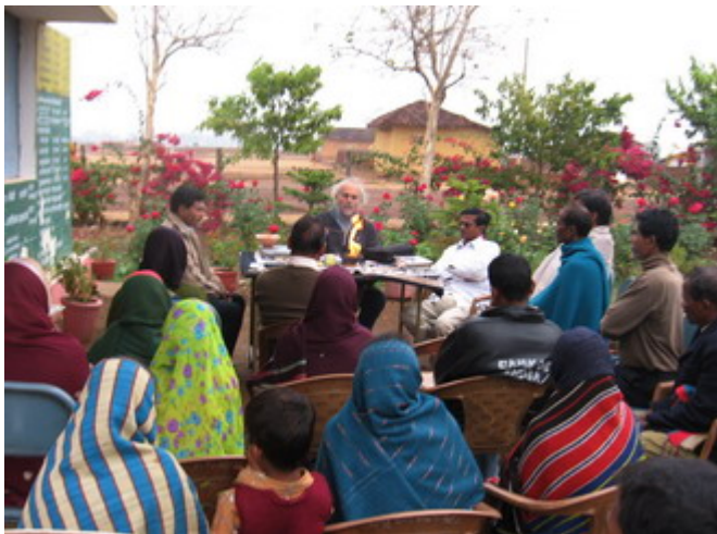
Pueblo Aheri, Dist. Durg