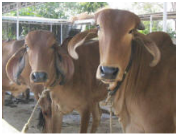
Las vacas nativas con joroba y sanas son un factor importante en la agricultura Homa.