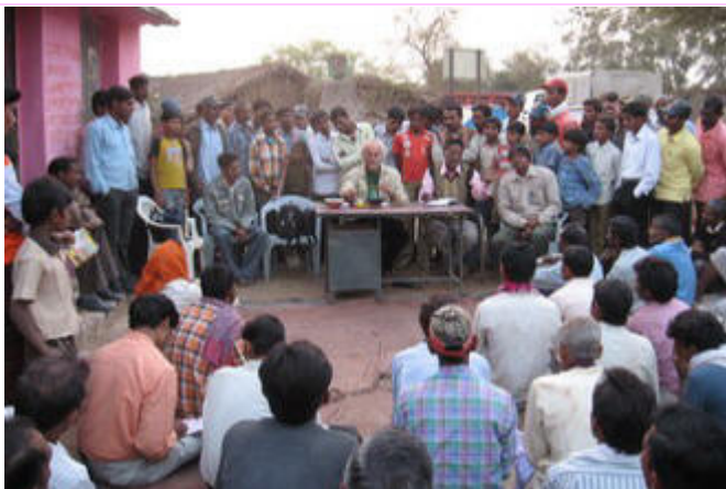
Pueblo Kothar, Dist. Tahsel Kwardha