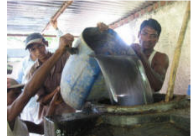
Preparación de Biosol Homa "Gloria", el cual está listo en menos de un mes.

Bosta de vaca, orina de vaca, humus de lombrices y ceniza de Agnihotra son esenciales para la preparación del Biosol "Gloria", el cual es muy apreciado por sus efectos rápidos y maravillosos.