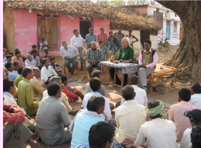
Pueblo Kabirdham, Kuthu Distrito