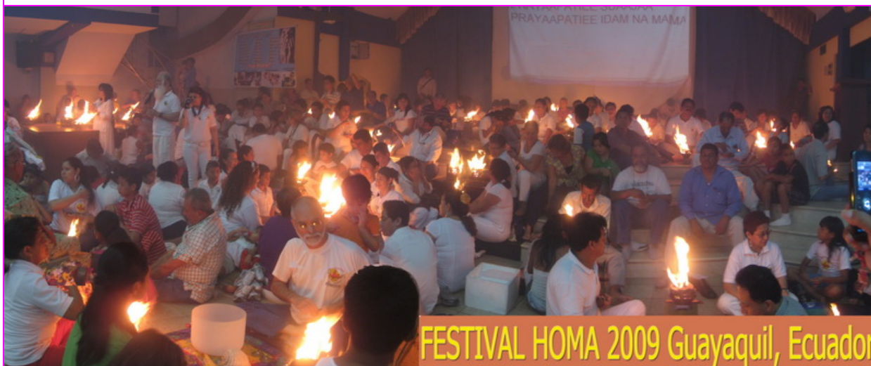
FESTIVAL HOMA 2009 Guayaquil, Ecuador

Una vez más el FESTIVAL HOMA 2009 ha sido un gran éxito en la difusión del mensaje de Sanación y Amor en una escala masiva. Hubo aún más fuegos sanadores de Agnihotra encendidos que en los años anteriores! El escenario se llenó de Agnihotris compartiendo sus fuegos frente a cientos de personas quienes recibieron con gratitud las energías curativas. Era un Festival llena de GRACIA y de compartir!